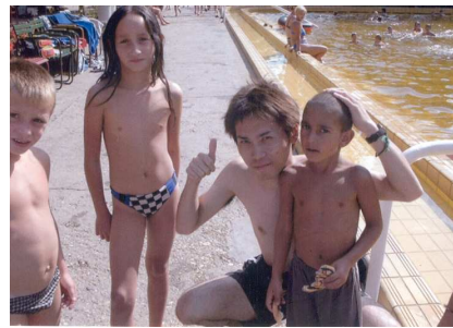
kapcsolat építés kultúrák között

Szintén a projekt keretei között a közösség több tagja belépett egy, a megyei Munkaügyi Központ által szervezett, az általános iskola befejezését célzó felzárkóztató és foglalkoztató programba; egy személy beiratkozott a Medgyessy Gimnázium érettségit adó esti képzésébe.