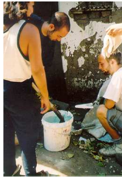
Az együtt végzett munka és